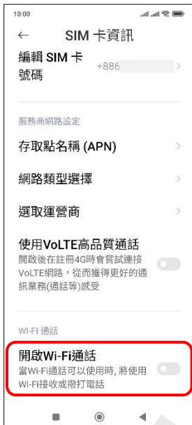
4. 開啟 Wi-Fi 通話 → 開啟