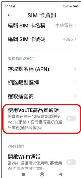
4. 使用 VoLTE 高品質通話→開啟