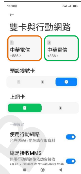
3. 選擇 SIM1/SIM2