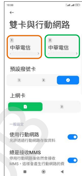
3. 選擇 SIM1/SIM2