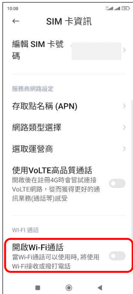
4. 開啟 Wi-Fi 通話 → 開啟