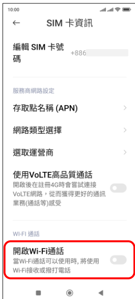
4.開啟 Wi-Fi 通話 →開啟