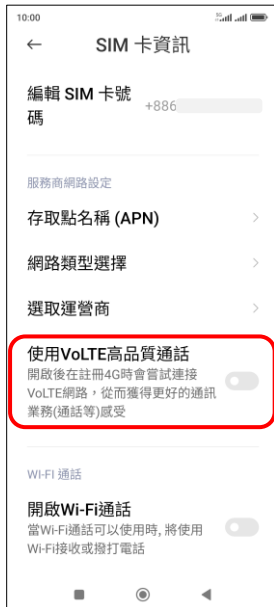
4.使用 VoLTE 高品質通話→開啟