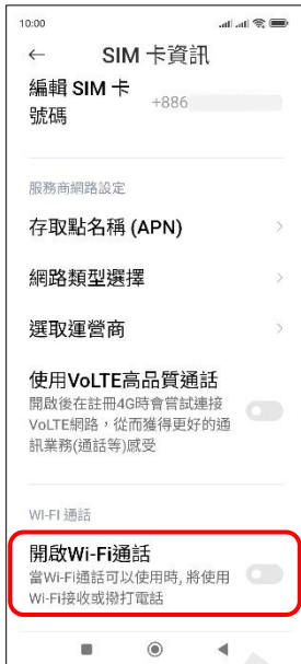
4.開啟 Wi-Fi 通話 →開啟