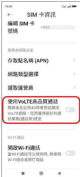
4.使用 VoLTE 高品質通話→開啟