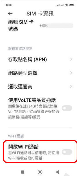
4.開啟 Wi-Fi 通話 →開啟