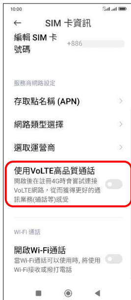
4.使用 VoLTE 高品質通話→開啟