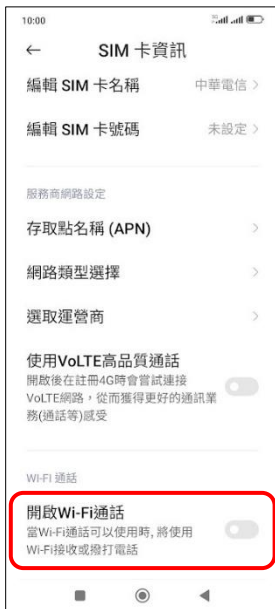
4.開啟 Wi-Fi 通話 →開啟