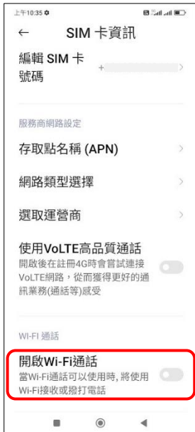
4. 開啟 Wi-Fi 通話 → 開啟