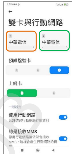
3. 選擇 SIM1/SIM2