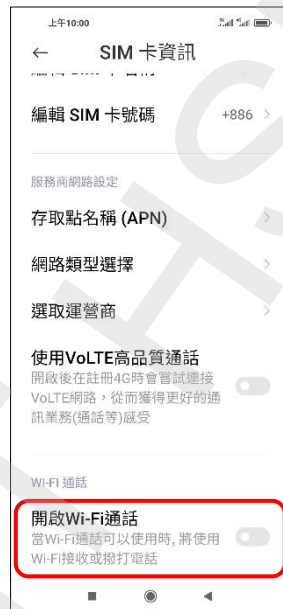
5. 開啟 Wi-Fi 通話→開啟