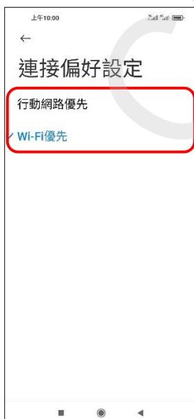
7. 自行選擇 (例：Wi-Fi 優先)