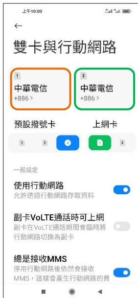
4. 選擇 SIM1/SIM2