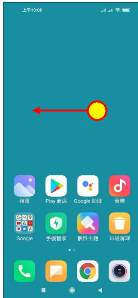
1. 往左滑進入應用程式