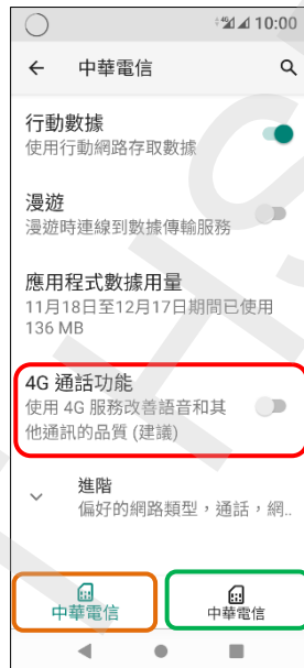
5. 選擇 SIM1/SIM2 4G 通話功能 開啟