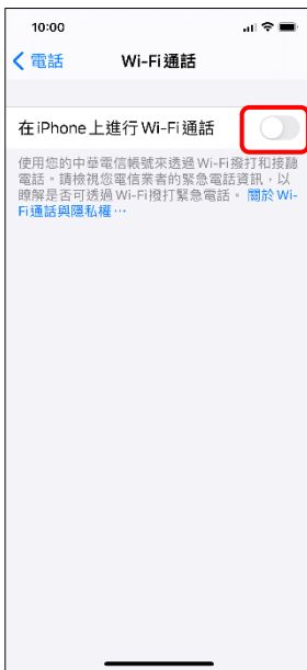
4. 在 iPhone 上進行 Wi-Fi 通話 → 開啟