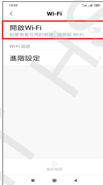
A-2.開啟 Wi-Fi 開