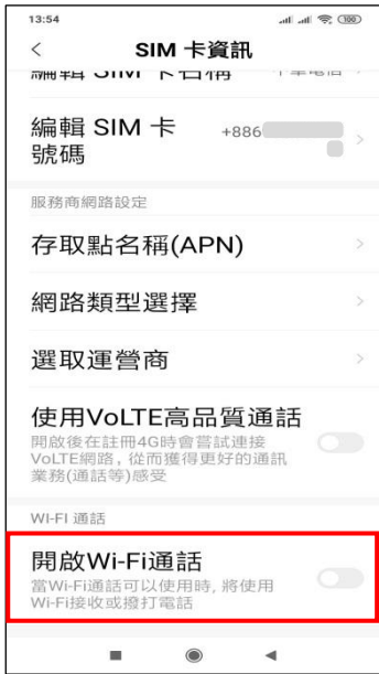
4.開啟 Wi-Fi 通話