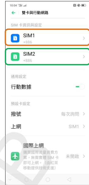
3.選擇 SIM1 /SIM2