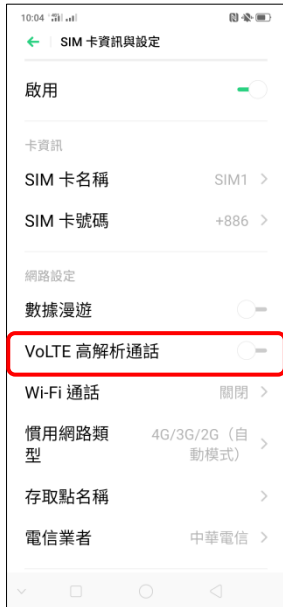
4.VoLTE 高解析通話 開啟