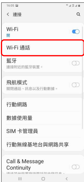
4. Wi-Fi 通話