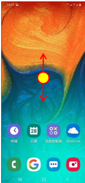
1. 向上或向下滑動以開啟應用程式螢幕