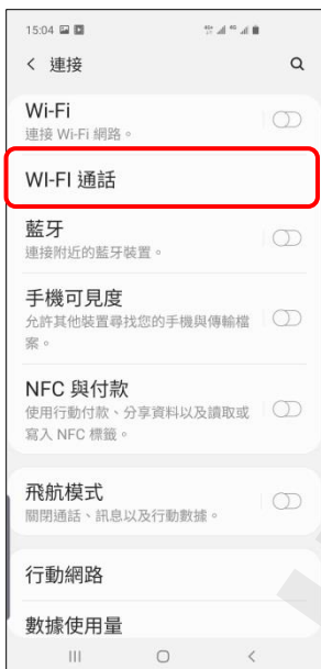
4. Wi-Fi 通話