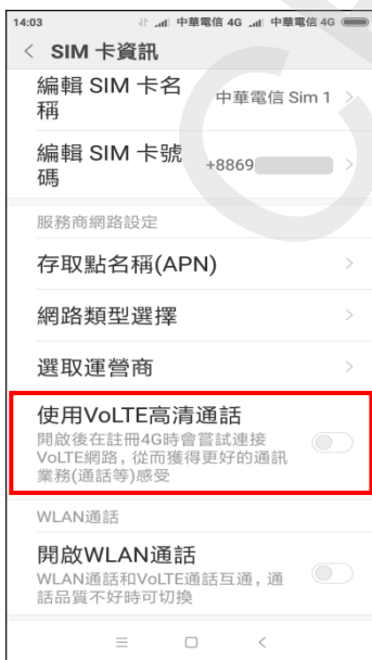
5.使用 VoLTE 高清通話