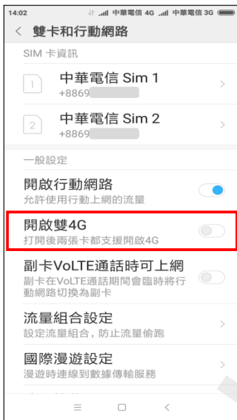
3.a-1.開啟雙 4G 開