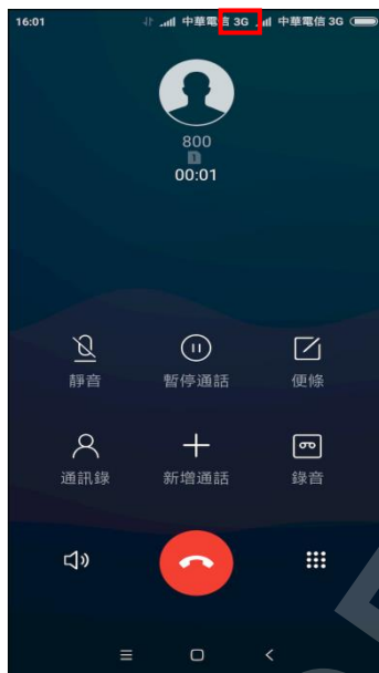
一般通話 (跳至 3G)