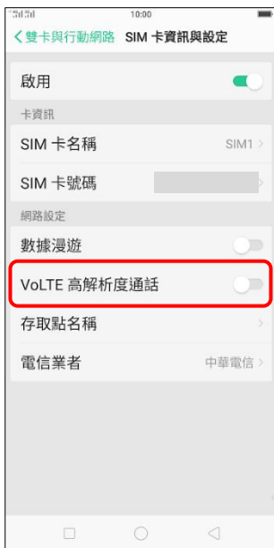
4.VoLTE 高解析度通話 ( 關 → 開 )