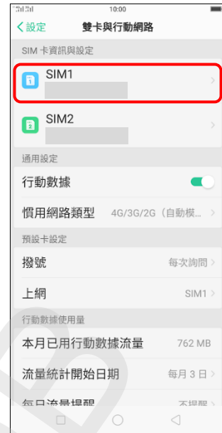
3.選擇 SIM1/SIM2 (例如：SIM1)